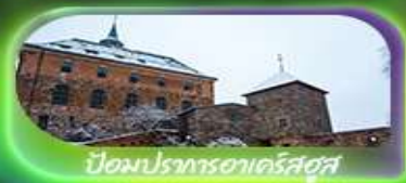
บิ่อมปราทธอาคร์สตุส