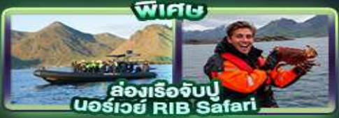
ฟรีคอง ส่องเรือจับปู นอร์เวย์ RIB Safari