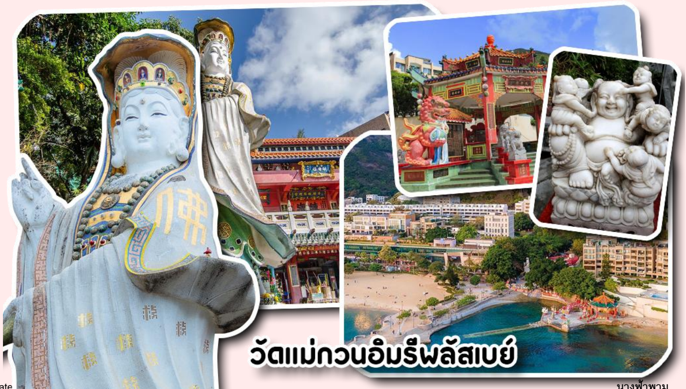
วัดแม่กวนอิมริพลัสเบย์

จากนั้นพาท่านเดินทางไปนมัสการ เจ้าแม่กวนอิมริมหาดริพลัสเบย์ วัดแห่งนี้ถูกสร้างขึ้นเพื่อคุ้มครองชาวประมงเวลาออกเรือไปหาปลาในสมัยก่อน บริเวณวัดมีสิ่งศักดิ์สิทธิ์มากมาย ได้แก่ เจ้าแม่กวนอิม ประดิษฐานอยู่ทางด้านซ้ายของวัด ซึ่งผู้คนนิยมเดินทางไปกราบไหว้ขอพรเรื่องการมีบุตร และยังมีพระสังกัจจายที่เชื่อกันว่าสามารถขอเพศของบุตรที่จะมาเกิดได้ โดยหลังจากกราบไหว้แล้วก็ให้ลูบที่ท้องของพระสังกัจจาย ถ้าอยากได้ลูกชายให้ลูบท้องซ้าย อยากได้ลูกสาวให้ลูบท้องขวา ถัดมาคือ เจ้าแม่ทับทิมเทพีแห่งท้องทะเล ท่านจะคอยคุ้มครองผู้เดินทางทางเรือ หรือผู้ที่เดินทางไปไหนมาไหนท่านจะคอยคุ้มครองให้ปลอดภัย และมีโชคลาก ถัดจากบริเวณที่กราบไหว้ขอพร ก็จะมีศาลาแปดเหลี่ยมริมน้ำ และสะพานเล็กๆ ที่ชื่อว่าสะพานต่ออายุ ซึ่งเชื่อกันว่าหากเดินข้ามสะพานแห่งนี้ 1 ครั้ง ก็จะมีอายุยืนขึ้น 3 ปี