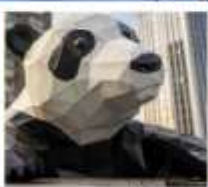
ห้าง IFS หมีแพนด้าปิงตึก