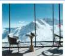
4860 COFFEE SHOP