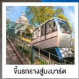
ขึ้นรถรางสู่มงมาร์ต