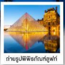
ถ่ายรูปปิพีร์อกันท์ลูฟร์