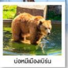
บ่อน้ำเมืองเบิร์น