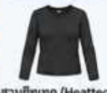
สวมฮีตเทค (Heattech) แบบหนาพิเศษด้านใน