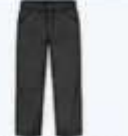
พร้อมกางเกงขายาว